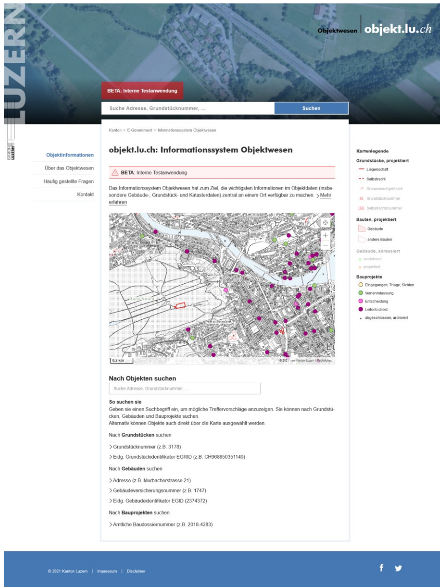
Abb. 2: objekt.lu, Informationssystem Objektwesen